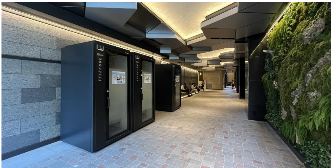
公共空間に設置している個室型ワークブース「テレキューブ」

テレキューブは、「全国の様々な拠点に広く展開している立地性」「2m サイズの大きな外部視認性」「室内の集中できる個室環境」といった特性を活かしながら、様々なコンテンツをお持ちのサービスと協業することで「ビジネス領域」から「生活領域」へサービス領域を拡大し、社会インフラとしての役割転換を加速させてまいります。テレビュー口を通じて、「あの相談がこの場でできたら」というニーズを叶え、より柔軟性のある生活様式の推進に貢献していきたいと考えています。