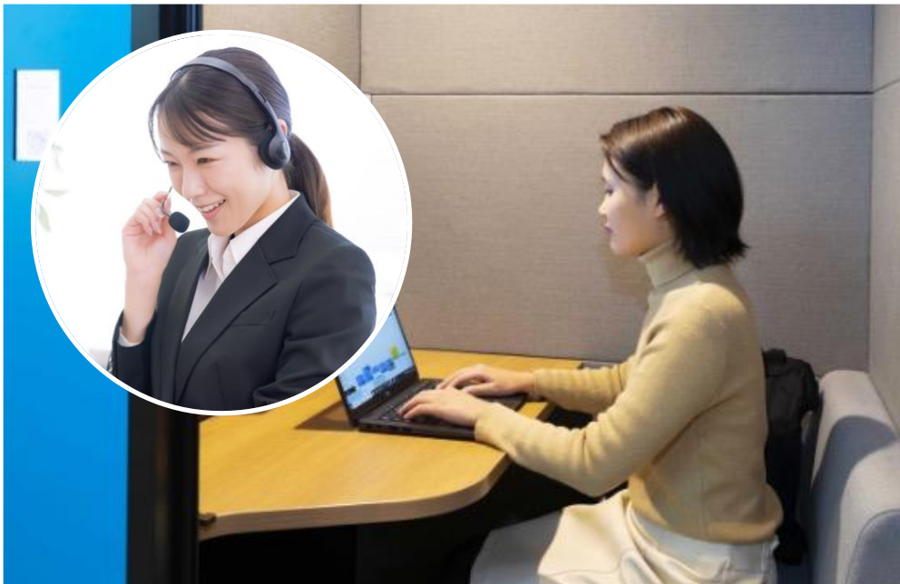
テレビューロを活用したオンライン相談のイメージ

一方、昨今ではビジネス利用にとどまらず、プライベートな相談ごとやカウンセリングなど機密性の高い面談、仕事の合間のリフレッシュやリラクゼーション、ライブ動画の視聴・配信など、幅広い用途にご利用される方も増えてきました。このような中、テレキューブサービスは、「オンライン金融相談」(三菱UFJ銀行様)や「ブランディア Bell」(デファクトスタンダード様)など様々なサービスと連携し、「生活領域」での用途でのテレキューブの活用モデル開発を進めてまいりました。