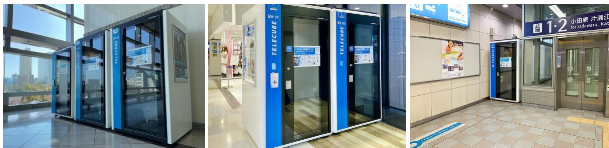
公共空間に設置している防音個室ブース「テレキューブ」

「AD テレキューブ」はテレキューブへのラッピング広告掲載、「チャンネル テレキューブ」はテレキューブ室内での商品体験・サンプリングを可能にするプランです。これにより、従来の「いつでもどこでも使えるワークブース」というビジネス用途に加え、カウンセリングやリラクゼーション、美容・健康など幅広い用途への新たな価値提供を進めてまいります。