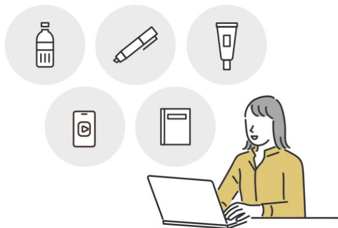
テレキューブとのコラボレーションのイメージ

いております。その中で、これまで「めぐリズム」(花王様)や「ブランディアBell」(デファクトスタンダード様)など様々な商品・サービスと連携し、新たな用途での価値づくりを進めてまいりました。