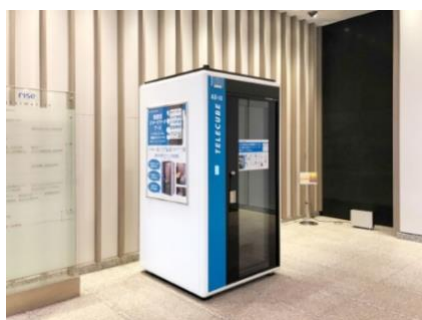
▲テレキューブ ニ子玉川ライズ オフィス棟