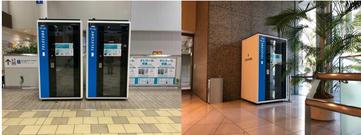
(写真左:西武鉄道所沢駅、写真右:山王パークタワービル)