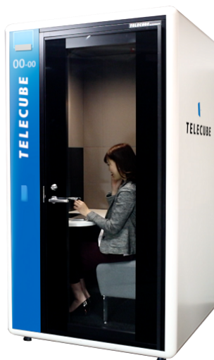
△テレキューブ外観（イメージ）