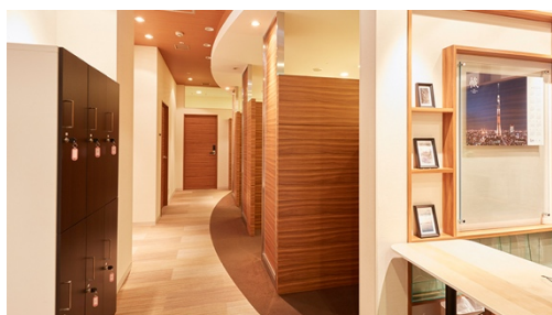
△サテライトオフィスふじみ野ナーレ