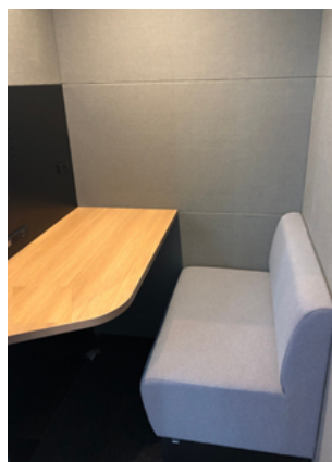
△テレキューブ内観（イメージ）

このリリースのお問い合わせは、東武鉄道(株)広報部（藪、野原）TEL 03-3621-5640 テレキューブサービス(株)広報 TEL 03-6386-5319